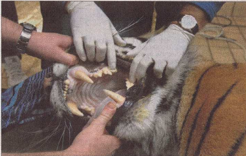
Die Tierärzte nutzen die Gelegenheit, sich die Zähne des narkotisierten Tigers anzusehen: Hier ist alles in Ordnung – keine Entzündung und kein Zahnstein.

Mit den Medikamenten und Untersuchungen kommen unerwartete Kosten auf den Verein zu. Wer helfen möchte, kann sich unter der Telefonnummer 0931/46634683 weiter informieren. Lara Hausleitner